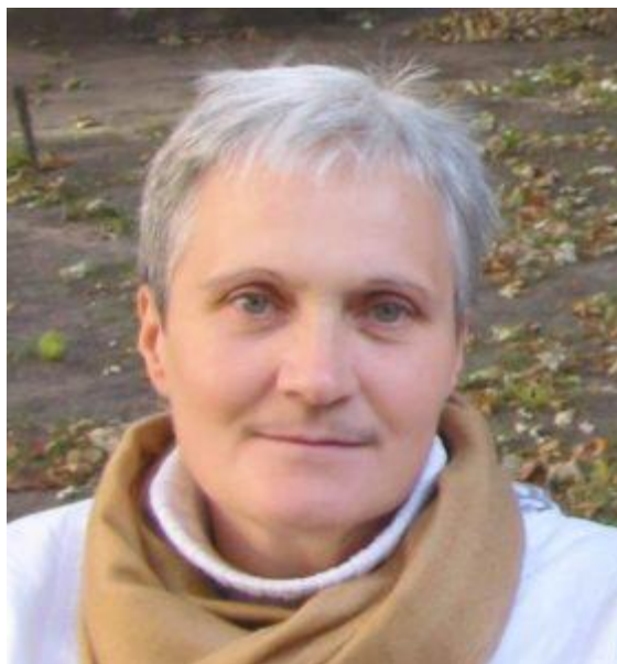
Маріанна (духовне ім'я)

Інша перейменована жінка стала Маріанною.