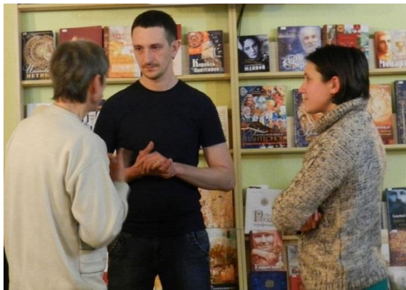
Зібрання у м. Харкові